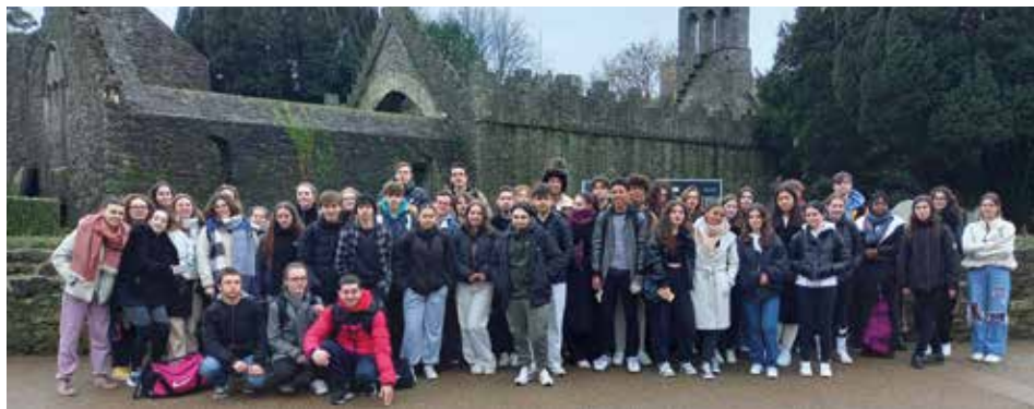
49 élèves avec notamment le groupe « Langues, littératures et civilisations étrangères » en voyage à Dublin en janvier 2023

Le lycée Blaise Pascal offre la possibilité à ses élèves de partir étudier dans un lycée étranger, pour une année entière. Ce programme, géré par le club Rotary de Segré-en-Anjou- Bleu (programme dénommé Student Exchange Programme) a permis à plusieurs élèves de partir aux États-Unis, au Mexique, à Taiwan... suivre une année de scolarisation.