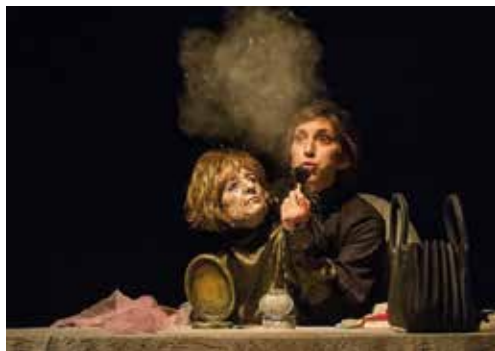
Tchaïka , Compagnie Belova, bord de plateau avec la comédienne et spectacle au Cargo (octobre 2022)

Depuis de nombreuses années, le lycée Blaise Pascal a établi un partenariat avec le centre culturel du Cargo, à Segré.