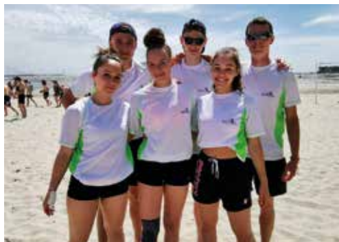
Les atlant'lycees à la Baule ; les champions du volley

L'association sportive du lycée s'organise autour de 3 pôles (animation, compétition, responsabilisation). Des activités variées y sont pratiquées : basket, Run & Bike, badminton, cross, escalade, volley, handball, futsal, judo, athlétisme, natation et musculation. Les élèves peuvent également participer à des rencontres sportives comme les Atlant' lycées, la journée promo filles et les Atlant' du 49.